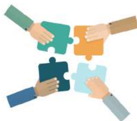
Gestion de projets